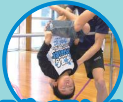
スポーツスクール